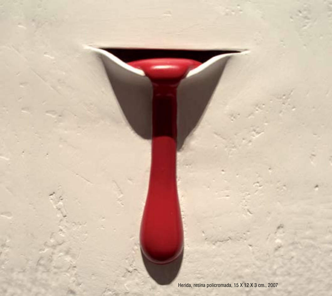
Herida, resina policromada, 15 X 12 X 3 cm., 2007