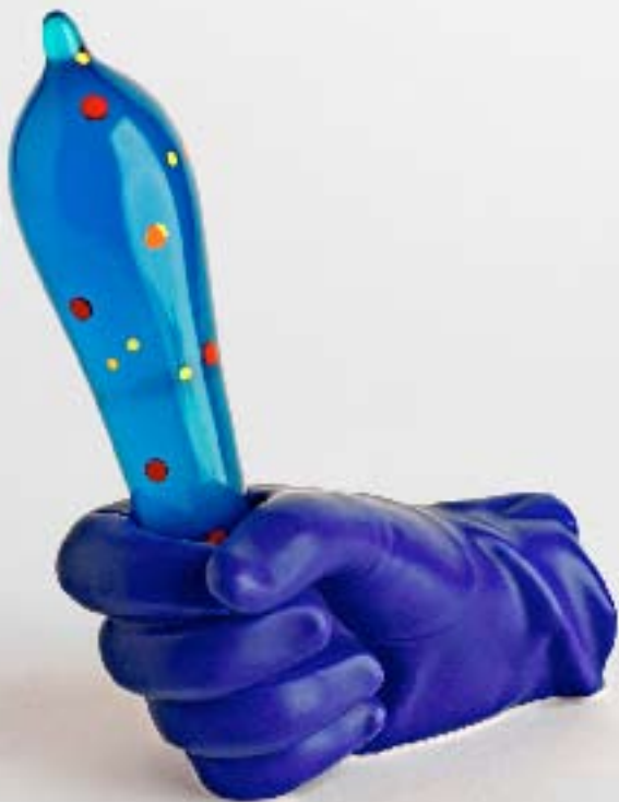
Mano azul-la mano de Juan, fotografía, 50 X 50 cm., 2007