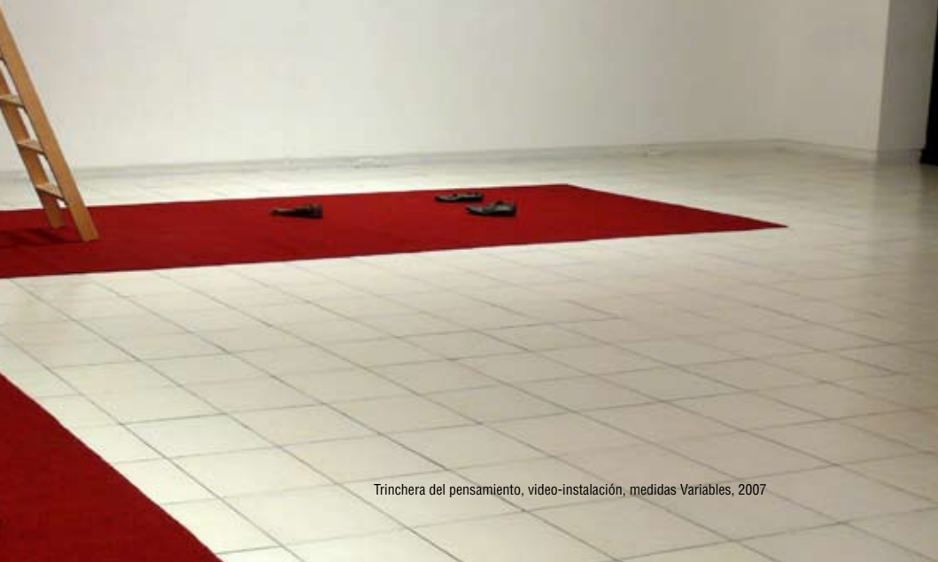
Trinchera del pensamiento, video-instalación, medidas Variables, 2007

Indiferencia perjudica gravemente su salud y la de los que están a su alrededor