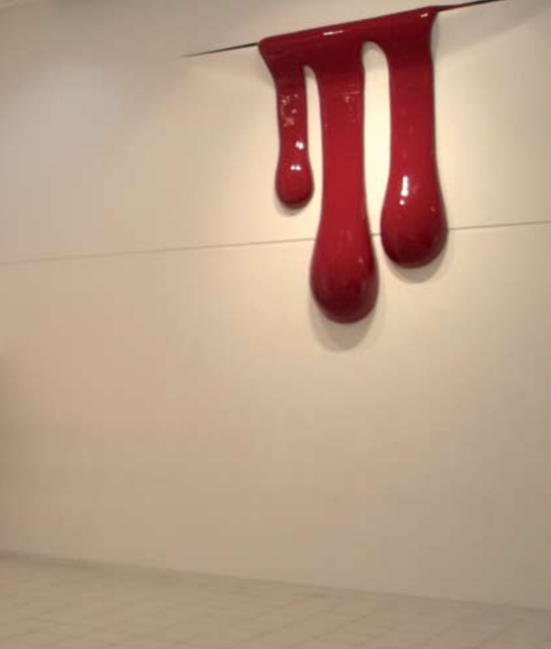
Vista de la exposición