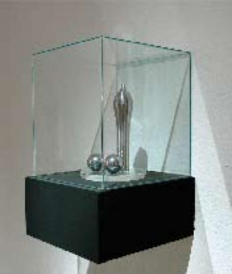
S/T, latón cromado, 23 X 12 X 9 cm., 2006