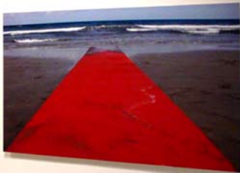
Welcome, (norte, sur, este, oeste) 4 fotos, formato digital / dibond, 75 X 120 cm., 2004-2005