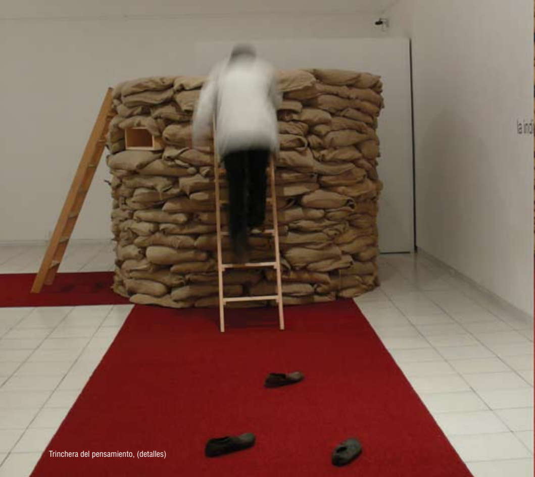
Trinchera del pensamiento, (detalles)