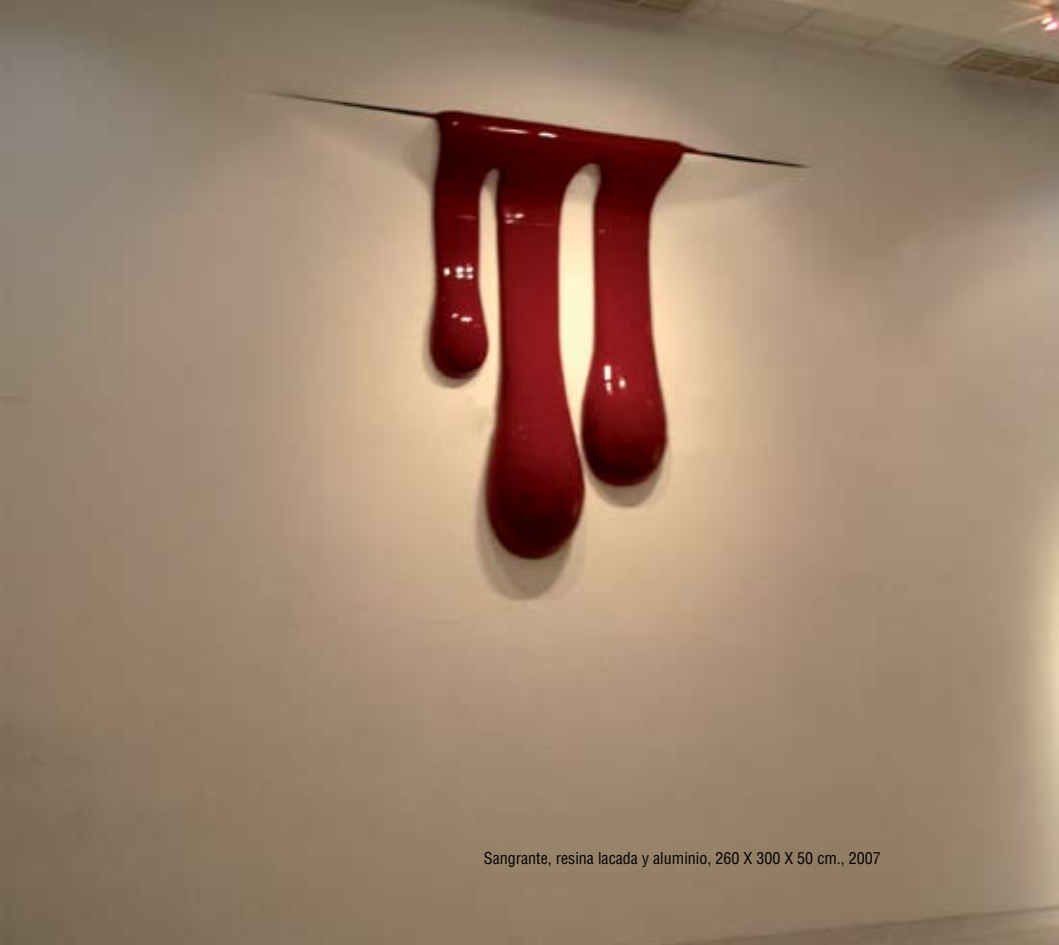
Sangrante, resina lacada y aluminio, 260 X 300 X 50 cm., 2007