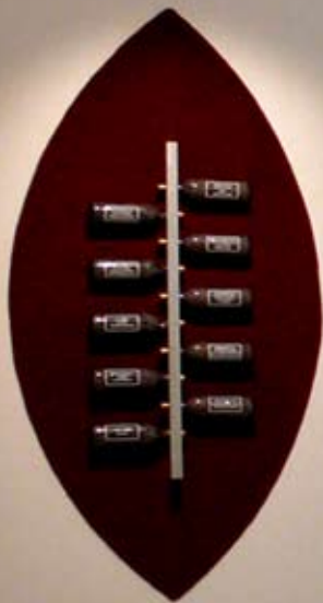
Grandes reservas, medidas variables, cristal, aluminio y tapete, 2005