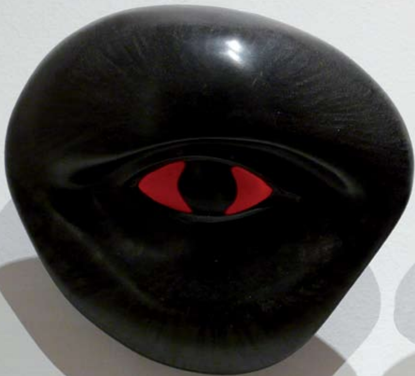
Desasosiego, resina pigmentada, 50 X 20 X 10 cm., 2004