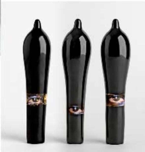
Señas de identidad, fotografía sobre dibond, 50 X 50 cm., 2006