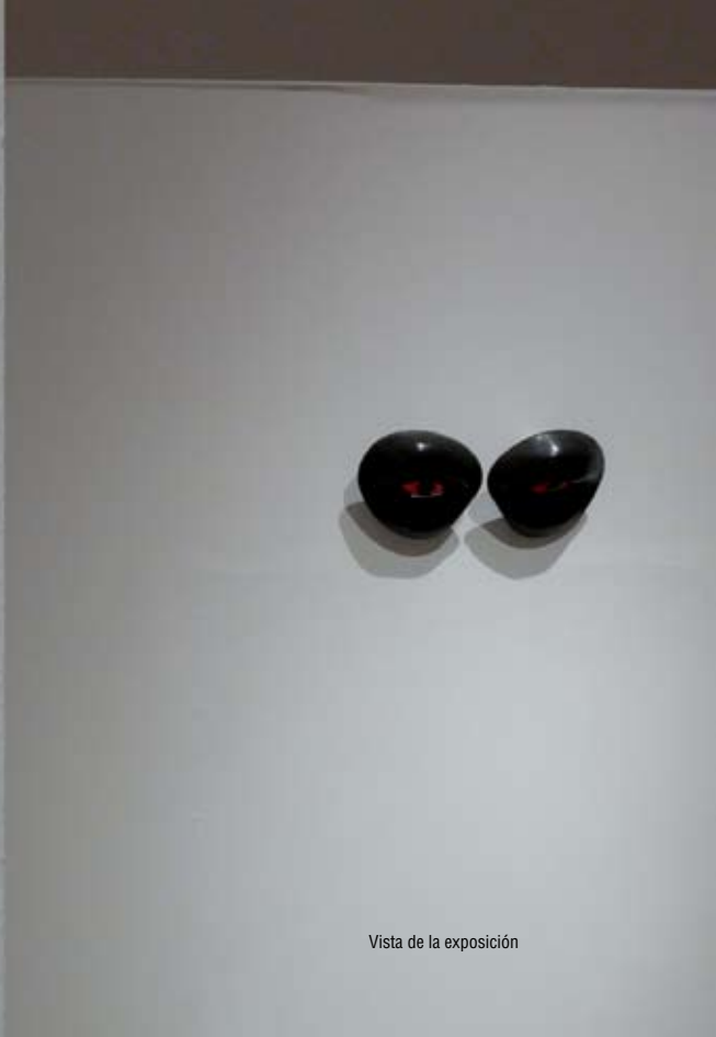
Vista de la exposición