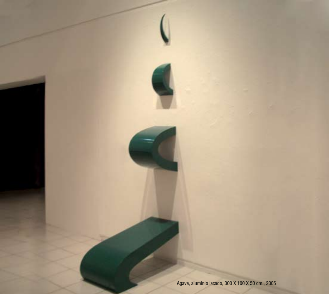
Agave, aluminio lacado, 300 X 100 X 50 cm., 2005